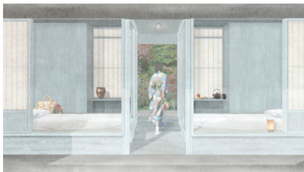
イラストはイメージです